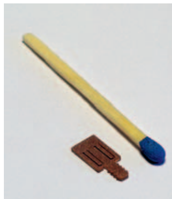
Im Gespräch zwischen SKWT und Industriepartner entstehen kreative Lösungen wie dieser Mikrostecker aus Kupfer für die Elektroindustrie.