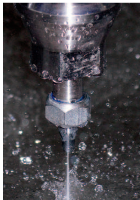
Den Wasserstrahl radikal verkleinern und mit Höchstpräzision führen, ist Forschungsschwerpunkt am Schweizer Kompetenzzentrum für Wasserstrahltechnologie (SKWT). Im Bild ein abrasiver Präzisionswasserstrahl mit d = 0,2 mm.

Europaweit führend auf diesem Gebiet ist die Schweiz, wichtiger Lieferant von Höchstdruckpumpen, Wasserstrahlschneidsystemen und kritischen Komponenten wie Düsen. Von den fünf international tätigen Düsen-