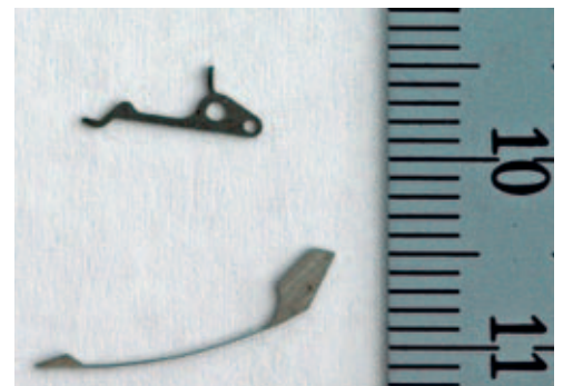
Abrasive Wasserstrahltechnologie ist oft die einzige Methode für die Bearbeitung hochsensibler Mikrokomponenten, um thermische Belastungen und Gefügeveränderungen zu verhindern. Im Bild mit AWJmm-Technologie geschnittene Präzisionskleinstteile.