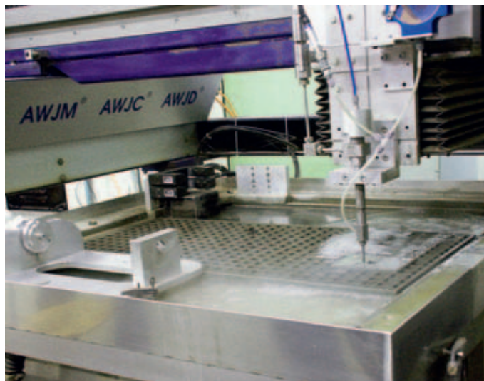
Unterstützt von Industriepartnern, vor allem der Waterjet AG, baut die Crew von Professor Heiniger eine in der Schweiz einmalige Infrastruktur auf, wie diese Prototypanlage einer Präzisionsschneidmaschine, im Bild in Betrieb mit einem klassischen Schneidkopf.

Steuerung und Maschine – Prozessparameter erfasst und sich auf jede beliebige Steuerung oder Maschine adaptieren lässt.